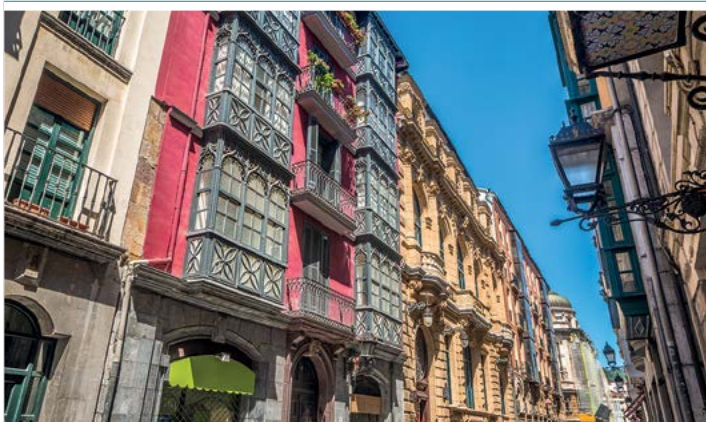
Budynki przy jednej z uliczek w Casco Viejo

bankierzy i armatorzy budują tu okazałe gmachy, zgodnie z modnymi wówczas tendencjami architektonicznymi, jakimi były eklektyzm i secesja. Lata 1970–1980 uważane są za szczyt kryzysu. Mimo to Bilbao podejmuje się niespodziewanej próby poprawy sytuacji, stawiając na sztukę współczesną – w 1997 r. otwarte zostaje Muzeum Guggenheima. Za przykładem Gehry’ego, architekci z całego świata prezentują swój talent w stolicy prowincji Vizcaya: Argentyńczyk Pelli buduje wieżę, Brytyjczyk Foster projektuje metro, Hiszpan Calatrava tworzy kładkę i nowy terminal na tutejszym lotnisku, Francuz Starck kieruje renowacją budynku po dużym składzie wina, w którym powstaje centrum kultury... Miasto zmienia swoje oblicze, a gospodarka zwraca się w stronę wysokich technologii i usług.