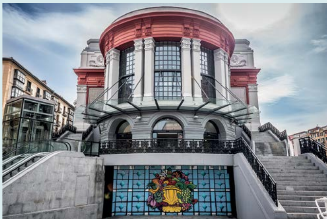
Mercado de la Ribera

Zwiedzanie miasta w niecodzienny sposób: na pokładzie statku lub, bardziej oryginalnie, w kajaku – dzięki czemu zobaczymy miasto z innej perspektywy i łatwiej dostrzeżemy zmiany, jakie tu zaszły od lat 80. XX w. Bilbao można zwiedzać również rowerem, z rozwianymi włosami, podążając tematyczną ścieżką, która dostarczy nam wielu ciekawych informacji o mieście. Zob. s. 19, 22.