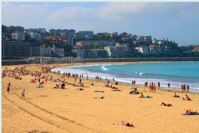
Plaża La Concha

Odkrywanie baskijskiej historii i folkloru poprzez wspaniale zaprezentowane zbiory Muzeum San Telmo: dyskoidalne stele nagrobne, przedmioty codziennego użytku, ale również fotografia i sztuka współczesna świadczące o bogactwie tej, jakże szczególnej, kultury. Zob. s. 98.